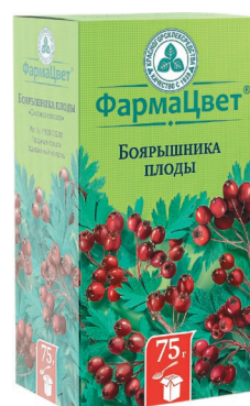
Боярышника плоды Кардиотоническое средство растительного происхождения Плоды цельные, 75 г