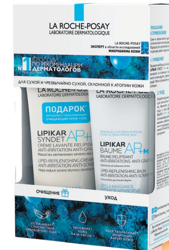
La Roche-Posay Подарочные наборы