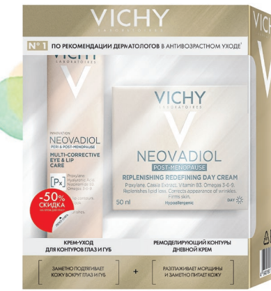
VICHY Подарочные наборы