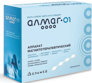
Алмаг-01 / Алмаг + аппарат магнитотерапевтический