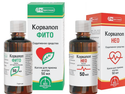
Корвалол Фито / Корвалол Нео Капли для приема внутрь, 50 мл