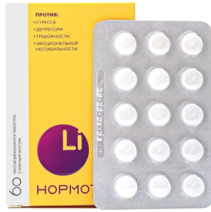
Нормотим Таблетки для рассасывания с мятным вкусом, №60