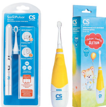
CS Medica Sonic Pulsar / CS Medica Sonic Pulsar Kids Зубная щетка электрическая, в ассортименте