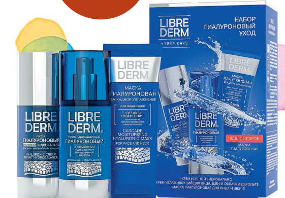
LIBREDERM Подарочные наборы