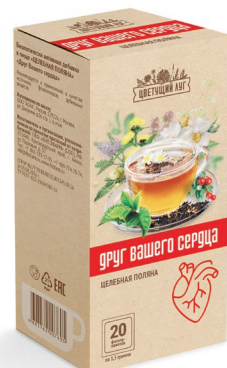
Друг вашего сердца Растительное средство при сердечно-сосудистых заболеваниях Фиточай, фильтр-пакеты, 1,5 г, №20