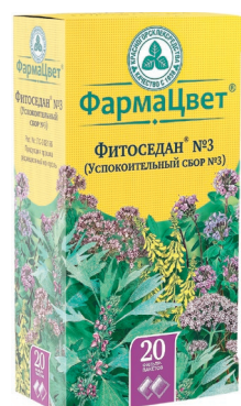
Фитоседан №3 (успокоительный сбор №3) Седативное средство растительного происхождения Сбор порошок, фильтр-пакеты, 2 г, №20