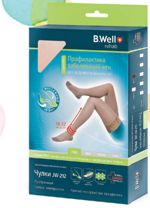
B.WELL арт. JW-212 Чулки компрессионные прозрачные I класс компрессии