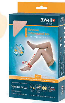
B.WELL арт. JW-222 Чулки компрессионные прозрачные II класс компрессии