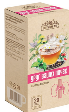
Друг ваших почек Растительное средство при заболеваниях почек Фиточай, фильтр-пакеты, 1,5 г, №20