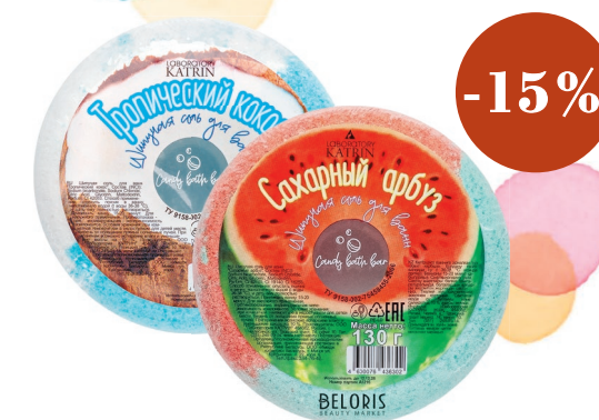
Candy bath bar «Пончик» Соль для ванн шипучая, 130 г, в ассортименте