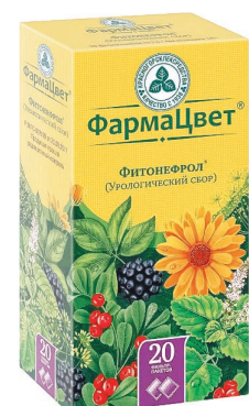
Фитонефрол (урологический сбор) Диуретическое средство растительного происхождения Сбор порошок, 2 г, №20

ИМЕЮТСЯ ПРОТИВОПОКАЗАНИЯ. ПЕРЕД ПРИМЕНЕНИЕМ НЕОБХОДИМО ОЗНАКОМИТЬСЯ С ИНСТРУКЦИЕЙ И ПРОКОНСУЛЬТИРОВАТЬСЯ СО СПЕЦИАЛИСТОМ