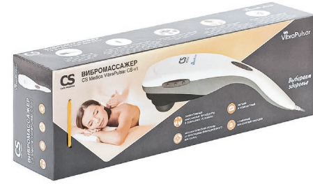
CS Medica VibraPulsar Вибромассажер CS-v1