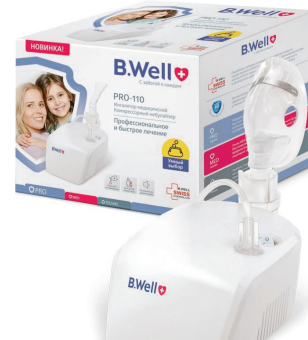
B.WELL PRO-110 Компрессорный небулайзер