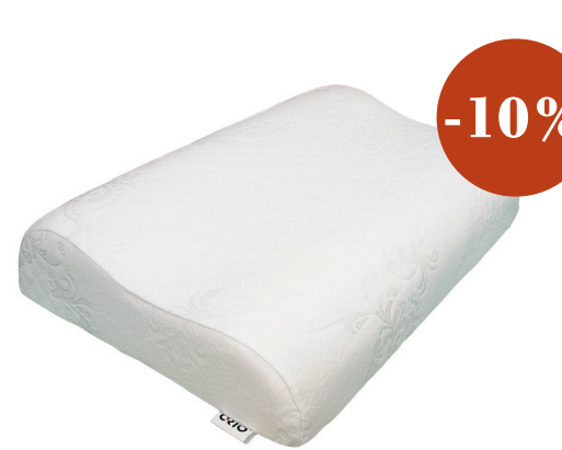
Подушки ортопедические В ассортименте