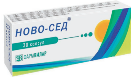
Ново-сед Капсулы, №30