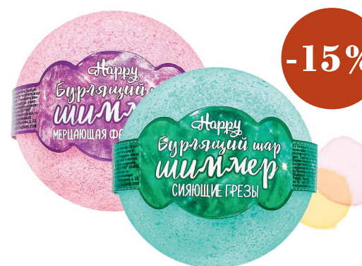
Happy Бурлящий шар для ванн с шиммером, 120 г, в ассортименте