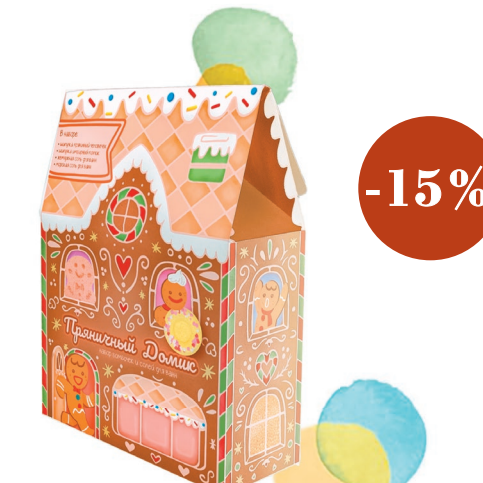
Candy bath bar «Пряничный домик» Косметический набор для тела, 400 г