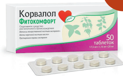
Корвалол Фитокомфорт Таблетки, №20, 50