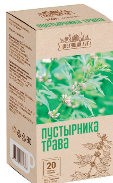
Пустырник Седативное средство растительного происхождения Фильтр-пакеты, №20