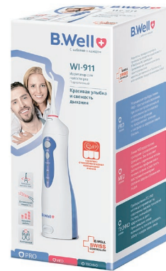
B.WELL WI-911 Ирригатор полости рта