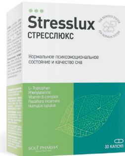
Стресслюкс Капсулы, №30