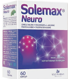
Солемакс Нейро Капсулы, №30, 60