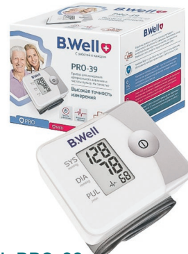
B.WELL PRO-39 Тонومتر автоматический на запястье