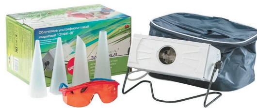
Облучатель ультрафиолетовый кварцевый ОУФК-01 / ОУФК-09-1 «Семейный»