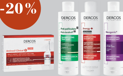
VICHY Гамма Dercos