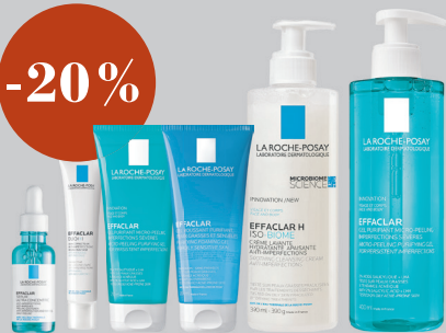
La Roche-Posay Гамма EFFACLAR